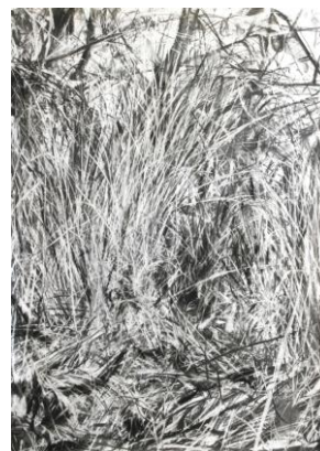
Figure 2 Dessin 02 2013